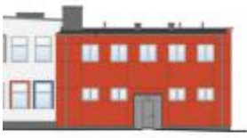
0 - POCZĄTEK